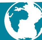
Schéma régional de cohérence écologique

Le Schéma régional de cohérence écologique (SRCE) de Bretagne a été adopté le 2 novembre par arrêté du préfet de la région Bretagne, après approbation par le Conseil régional les 15 et 16 octobre, et tel qu'il avait été validé par le comité régional le 9 juillet. Cette adoption doit aussi marquer le point de départ de la mise en œuvre du SRCE, en s'appuyant sur les initiatives des acteurs et territoires de la région. Un appel à manifestation d'intérêt puis un appel à projets régional seront prochainement lancés, en faveur de plans d'actions territoriaux pour la préservation et la restauration des continuités écologiques.